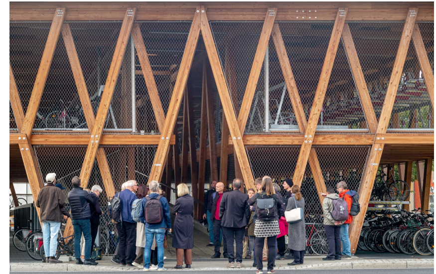
Sonderpreis des Brandenburgischen Baukulturpreises 2023: Fahrradparkhaus Eberswalde, Leitplan mit ifb frohloff staffa kühl ecker, Berlin, © Andreas Fink MIL

Beiträge AG Architektur+Schule, Brandenburgische Architektenkammer Brandenburgischer Handwerkskammertag BTU Cottbus-Senftenberg FG Stadtmanagement Bund Deutscher Architektinnen und Architekten Brandenburg