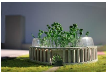
Baumkuppel im Lustgarten