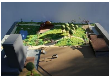
Sport- und Konzertbühnen im Lustgarten