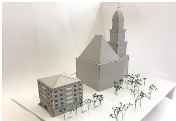
Wohnpalais Garnisonkirche