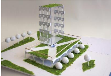
Renaissance-Fassade Mercure-Hotel

Pressebildanfragen presse@alexander-paul.com