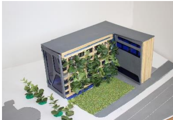
Ökologische Sanierung Staudenhof