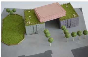
Hotel in der ehem. Fachhochschule © Shanice Inyinbor, Emilia Koliada & Thure Kuhnke