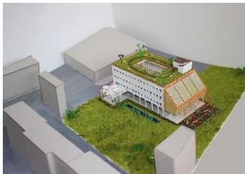
Hochschulgebäude Feuerwache